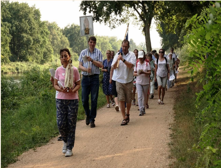
Pilgern entlang des Elbe-Lübeck Kanals

Hochamt mit Kräuterweihe: 18 Uhr Open Air im Kirchengarten der Marienkappelle Maria Treu